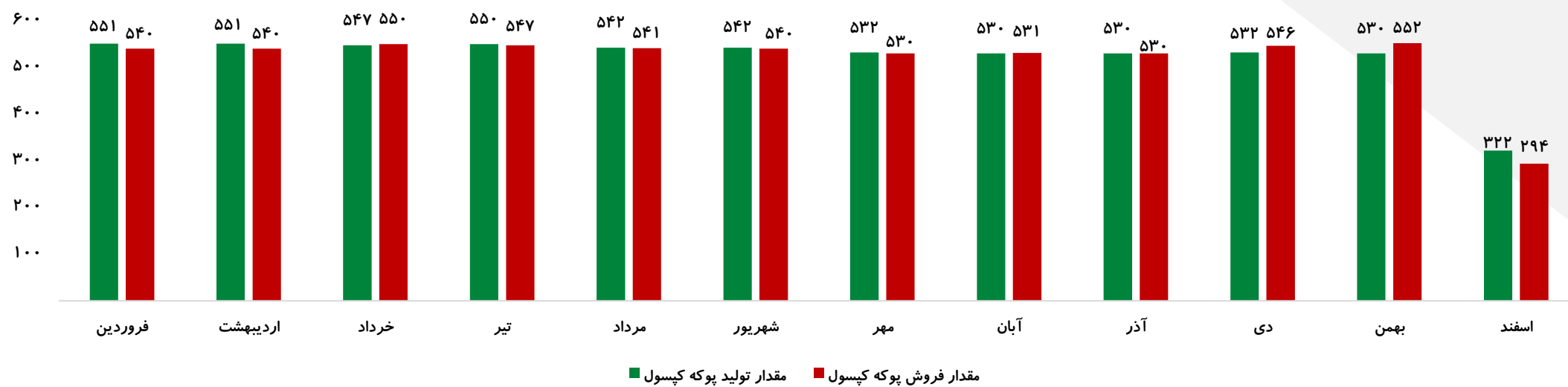
مبلغ فروش ماهانه سال مالی ۱۴۰۰